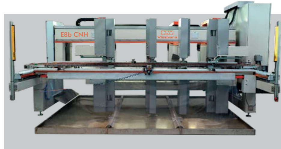
E8b CNH HORIZONTAL