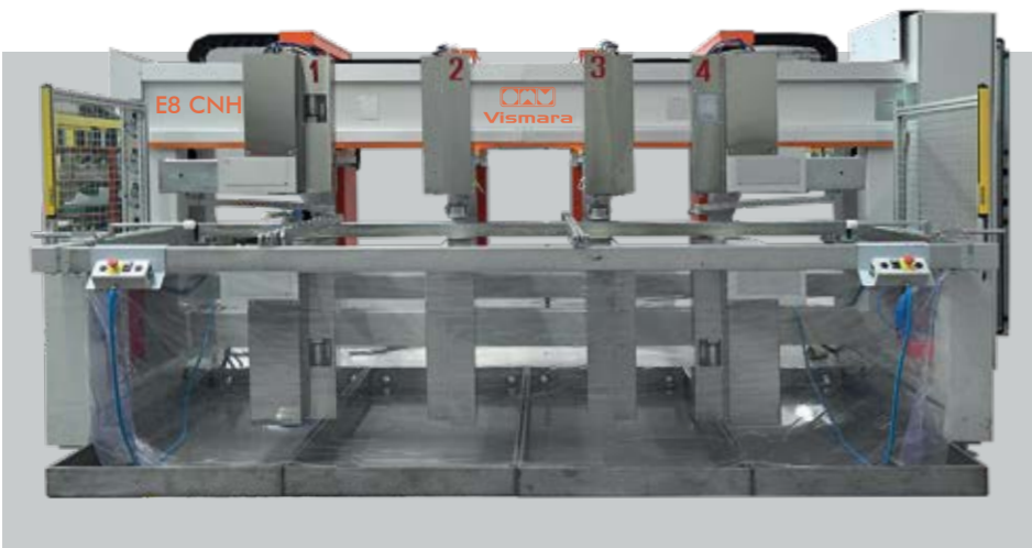
E8 CNH HORIZONTAL